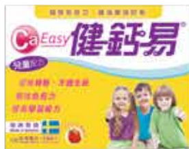
CaEasy Children Formula