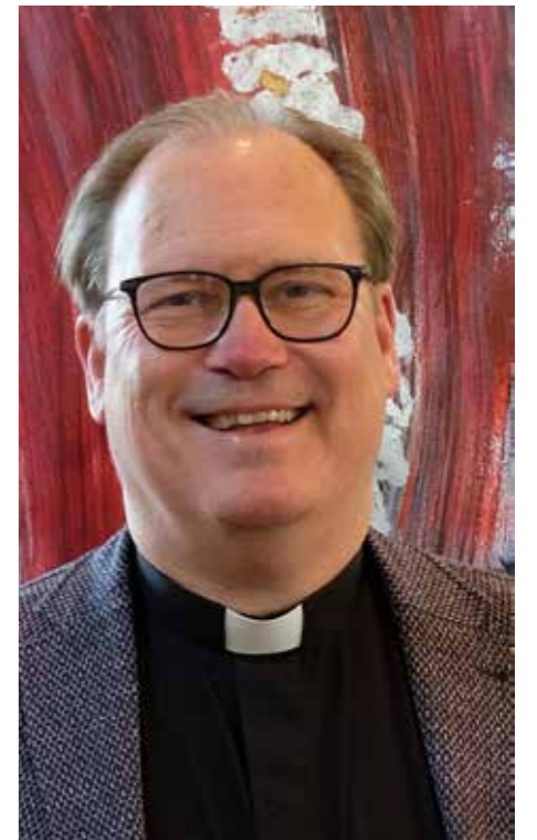
I julevangeliet möts ljus och mörker, hopp och förtvivlan