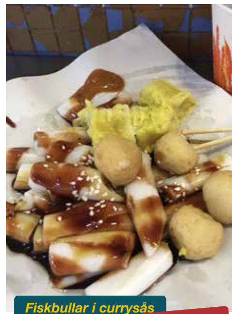
Fiskbullar i currysås

För många som har varit utomlands en längre tid, är det första de äter när de är tillbaka i Hongkong just en skål med wonton nudelsoppa.