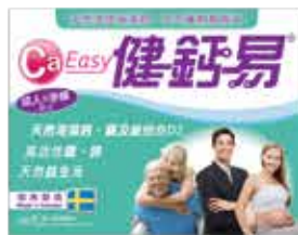
CaEasy Adult & Pregnancy Formula