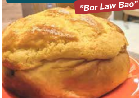
"Bor Law Bao"

Trots sitt namn innehåller ananasbulle ingen ananas. Snarare heter den så på grund av dess förmodade likhet med den tropiska frukten. Den söta krispiga skorpan på toppen är gjord av socker, ägg, mjöl och ister, bakad tills den är gyllenbrun och smulig. Den läckra godbiten äts bäst direkt ur ugnen eller med en tjock skiva kallt smör i mitten – det är inte hälsosamt på något sätt, men det är det som gör det så bra.